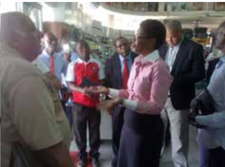
Fiscalização aos agentes económicos de Nampula