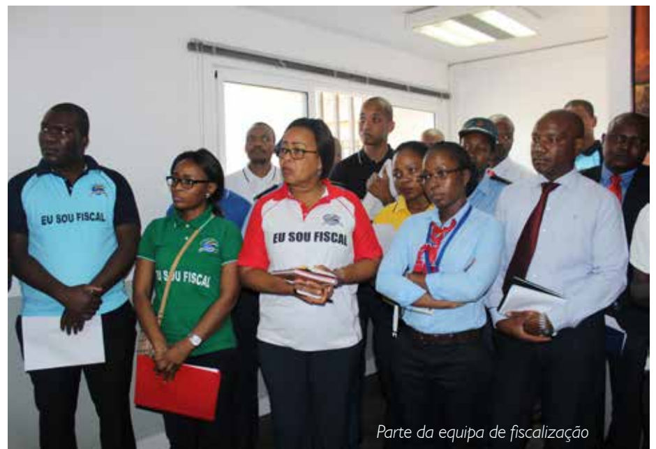
Parte da equipa de fiscalização

desiderato, a AT criou treze (13) equipas de trabalho, para Cidade de Maputo, das quais fazem parte, para além da respectiva presidente, os Directores Gerais, Directores Gerais Adjuntos e Chefes de Divisão.