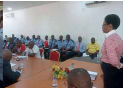
Encontro com os funcionários