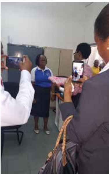
Homenagem à melhor funcionária