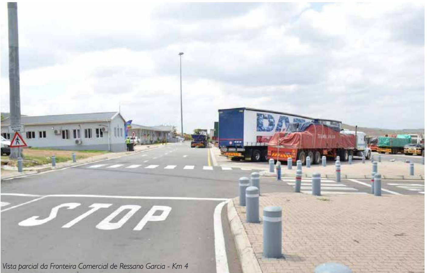
Vista parcial da Fronteira Comercial de Ressano Garcia - Km 4