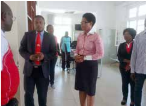
Visita ao Juízo das Execuções Fiscais de Nampula