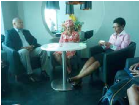
Encontro de cortesia com a Directora Provincial de Economia e Finanças - Nampula