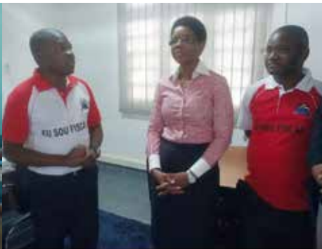
Visita à DAF de Nampula