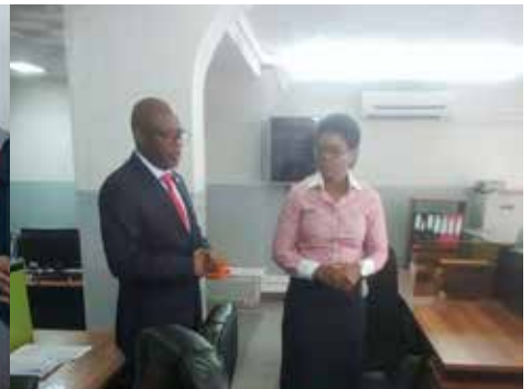
Visita à UGC de Nampula