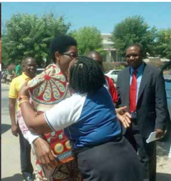
Recepção da Exma PAT na DAF de Nampula