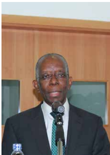
Adriano Maleiane Ministro da Economia e Finanças

Numa outra abordagem, a palestrante reconheceu o papel preponderante desempenhado pelo MEF, numa altura em que o país atravessa uma conjuntura económica menos favorável, contudo, as mulheres lado a lado com o homem, têm se engajado no trabalho de modo a prover o